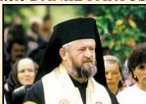
- episcop de Varscet -